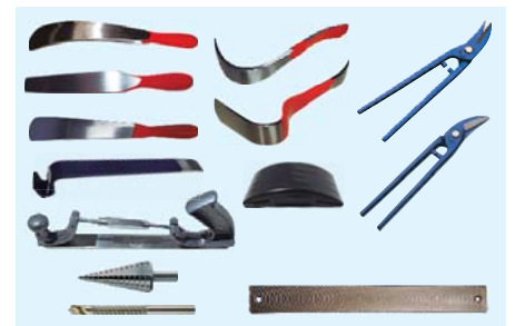
3.º Cajón 3.º Drawer

F-6, 4018 TREBOL, 4820 TREBOL, TAPON: US-839 / US-876