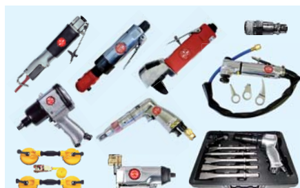
5.º Cajón 5.º Drawer

JAR-136, RO066151, US-382, US-412, US-597, US-678, US-788, US-851, US-853