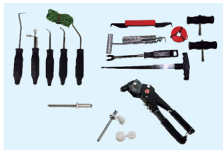
2.º Cajón 2.º Drawer

US-49, US-158/A, US-159, US-162, US-186, US-226, US-687, US-773, US-774, US-775, US-776, US-1180