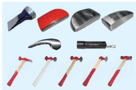
1.º Cajón 1.º Drawer

US-49, US-158/A, US-159, US-162, US-186, US-226, US-687, US-773, US-774, US-775, US-776, US-1180