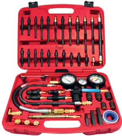
Peso - Weight 4,1 Kg